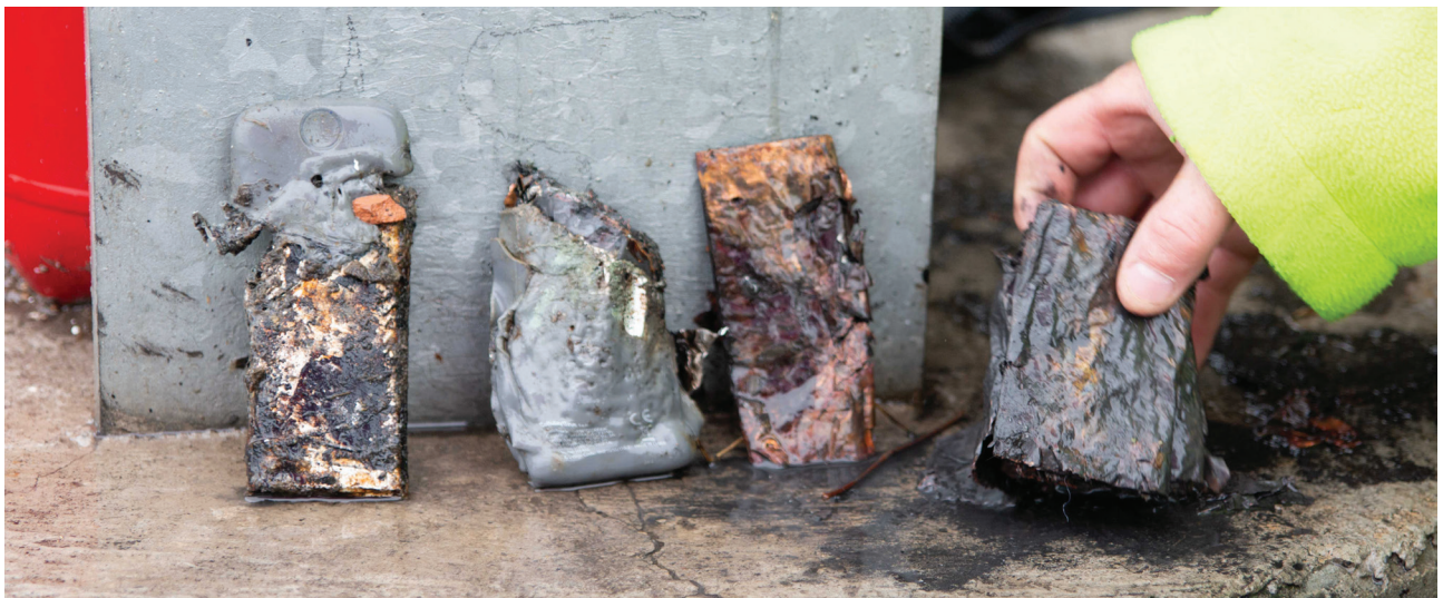
Batterie lithium-ion ou accumulateur lithium-ion